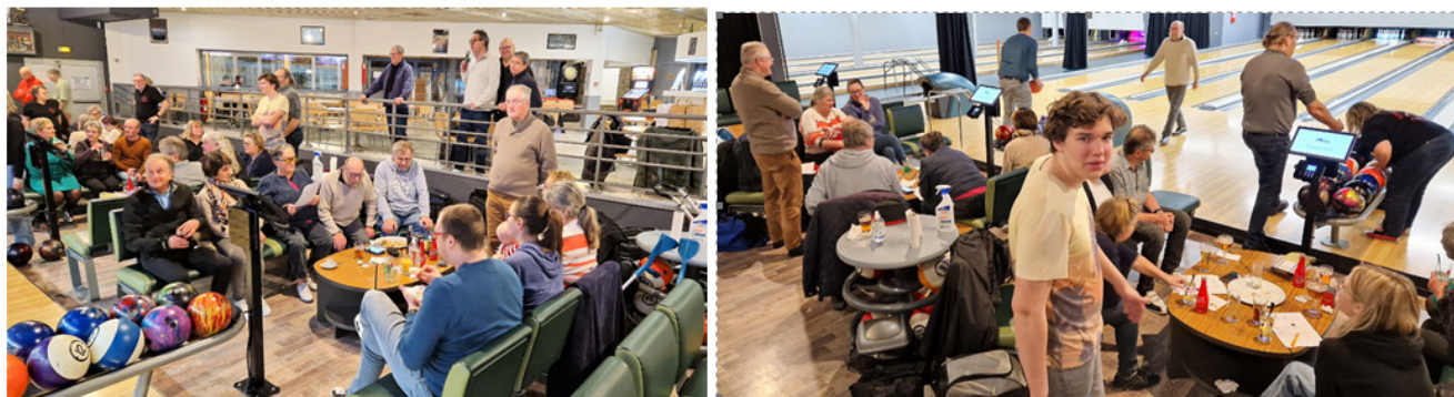
Les participants et les Gos