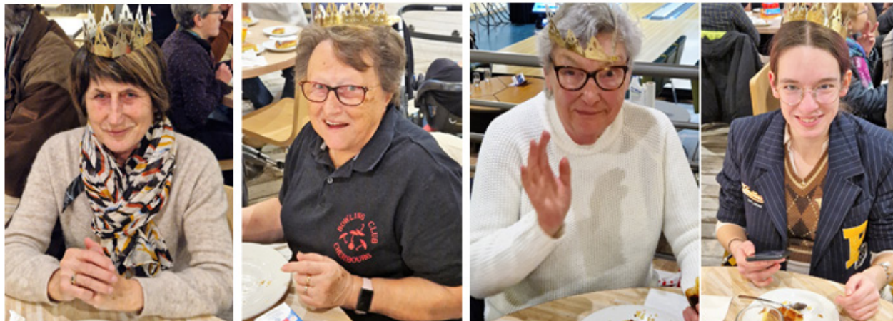
Les Reines de la Soirée

Mardi 17 janvier 2023, le Bowling club de Cherbourg fêtait les Rois (et les reines) lors d'une soirée divertissante à base de petits jeux d'adresses. 36 joueurs étaient sur les pistes pour tenter de devenir les rois de la soirée. A l'issue des parties, tout ce petit monde, accompagné des GO de la soirée, partagea quelques parts de galettes des Rois.