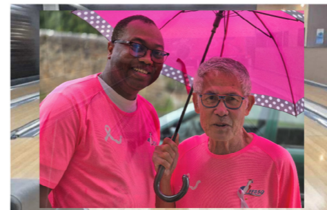
Une journée de bowling à Sablé-sur-Sarthe, dimanche 13 octobre 2024, dans le cadre d'Octobre Rose.

Bowl'maine, le club de bowling de Sablé-sur-Sarthe organise une journée de bowling pour Octobre Rose, au profit de la Ligue contre le Cancer, dimanche 13 octobre 2024, de 9h à 18h.