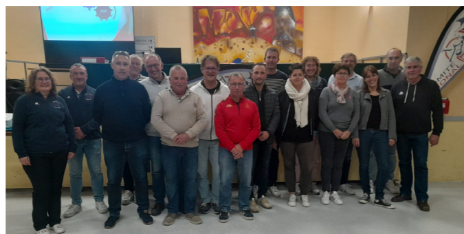
Les nouveaux élus de la CSN des Quilles de 8 en compagnie du CTF