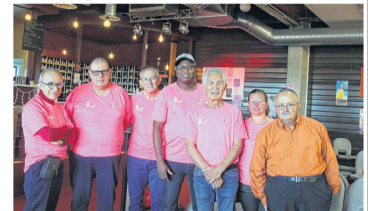
Les dirigeants et le Dr Issad ont informé sur le dépistage précoce

Ce dimanche, à l'entrée du bowling de Sablé, trônait un stand d'information et de sensibilisation du cancer du sein. Une action mise en place par Bowl'Maine.